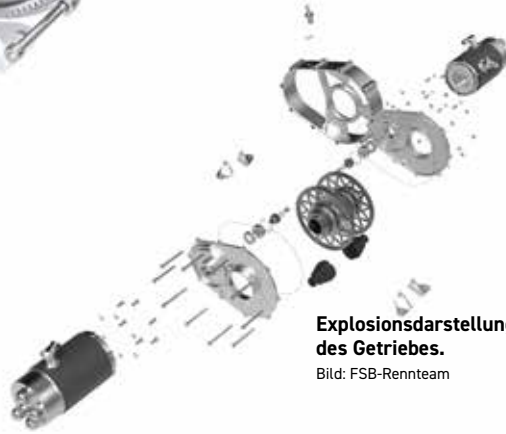
Explosionsdarstellung des Getriebes.