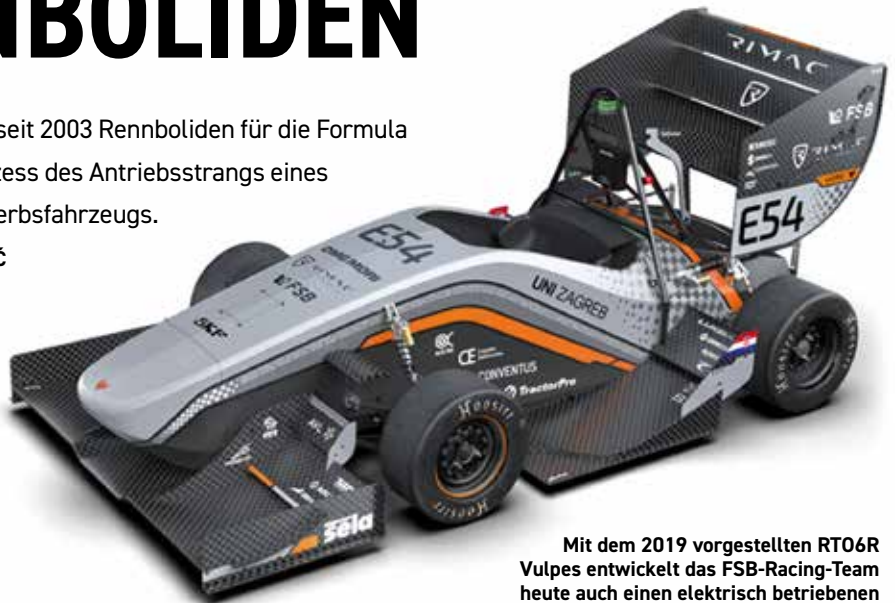
Mit dem 2019 vorgestellten RT06R Vulpes entwickelt das FSB-Racing-Team heute auch einen elektrisch betriebenen Rennwagen stetig weiter.

In den letzten 18 Jahren hat das Team 9 Rennwagen gebaut und ist durch ganz Europa gereist, um an vielen jährlichen Formula-Student-Wettbewerben teilzunehmen. Jedes Projekt stellt die Studenten dabei vor neue Herausforderungen. Es ist ein langer und mühsamer Prozess von den ersten Konzepten und Meilensteinen bis hin zur erfolgreichen Herstellung und Montage der einzelnen Komponenten und schließlich der fertigen Fahrzeuge. Dabei wird jedes Bauteil von