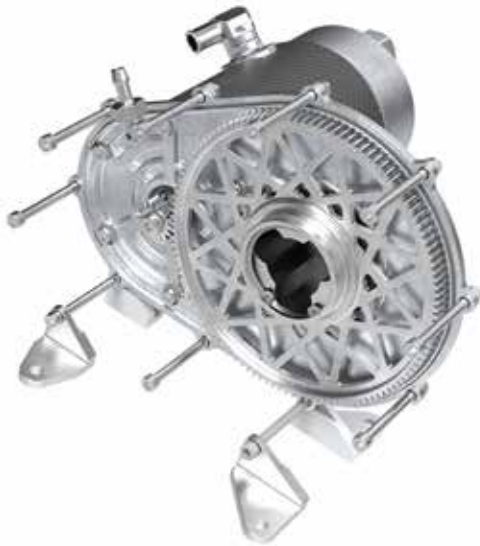
Rendering des einstufigen Getriebes.